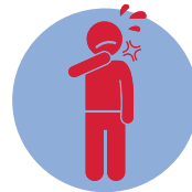
Боль в горле