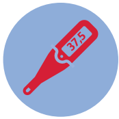
Температура (выше 37,5° C)