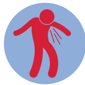
Кашель и/или чихание